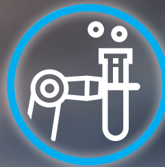
AUTOMATISIERUNG VON LABORPROZESSEN